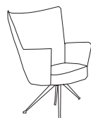
LS 53 - PS 55 - HS 46