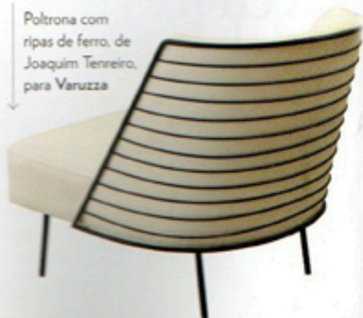
Poltrona com ripas de ferro, de Joaquim Tenreiro, para Varuzza