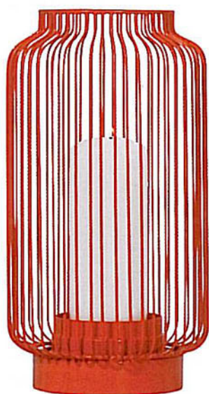
Photophore Fil rouge, 75 €. Home autour du Monde.