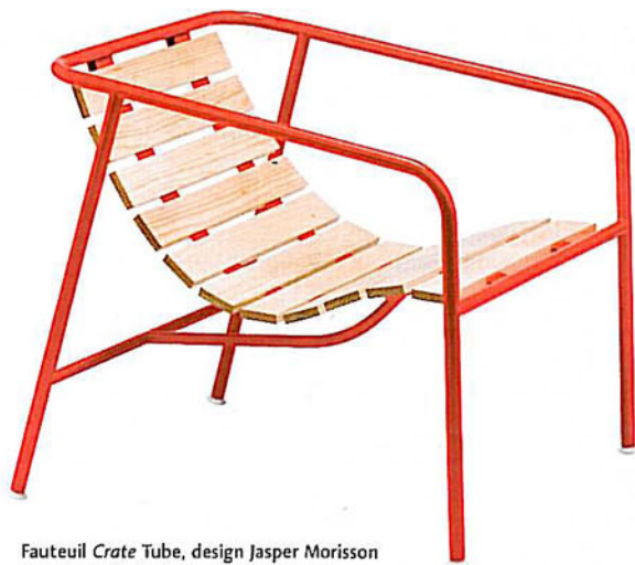
Fauteuil Crate Tube, design Jasper Morisson 790 €. Established & Sons chez Merci.