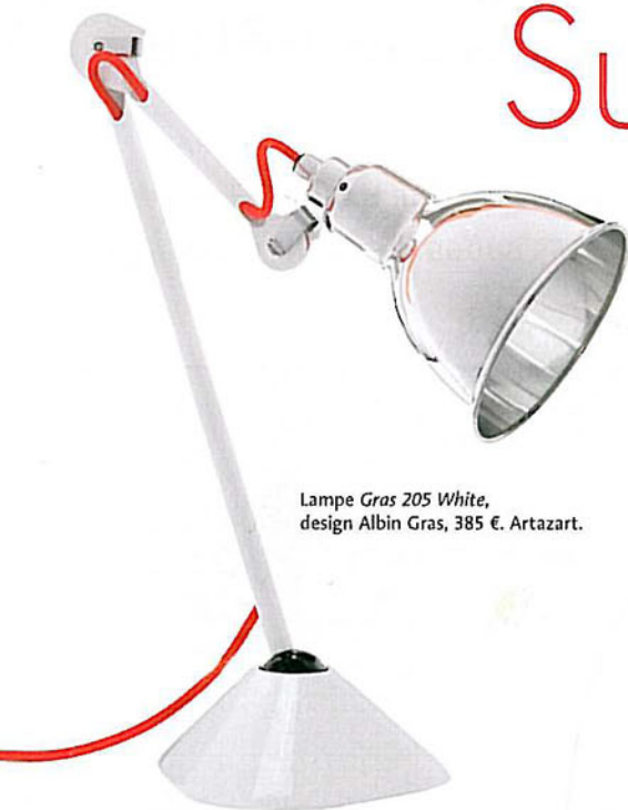
Lampe Gras 205 White, design Albin Gras, 385 €. Artazart.