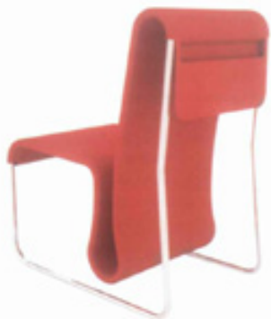
Von links: Wäschebaum Alberto von Fabrica für Casamania by Frezza; Stahlrohrstuhl Farallon von Yves Béhar für Danese; Polsterstuhl Hollow von Patricia Urquiola für Moroso.